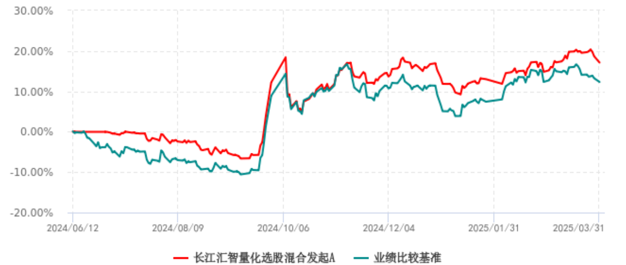
长江汇智量化选股混合发起A累计净值增长率与业绩比较基准收益率历史走势对比图 (2024年06月12日-2025年03月31日)

注：（1）本基金的业绩比较基准为中证 500 指数收益率*70%+中债综合指数收益率*20%+恒生指数收益率（使用估值汇率折算）*10%；（2）本基金基金合同生效日为 2024 年 06 月 12 日。