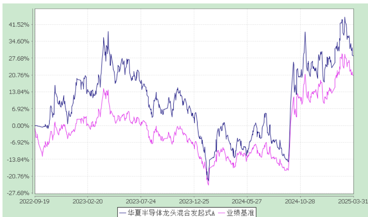
华夏半导体龙头混合发起式 C: