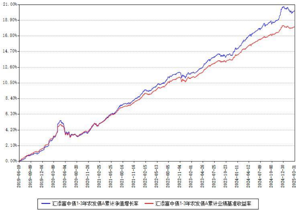
汇添富中债1-3年农发债A累计净值增长率与同期业绩基准收益率对比图