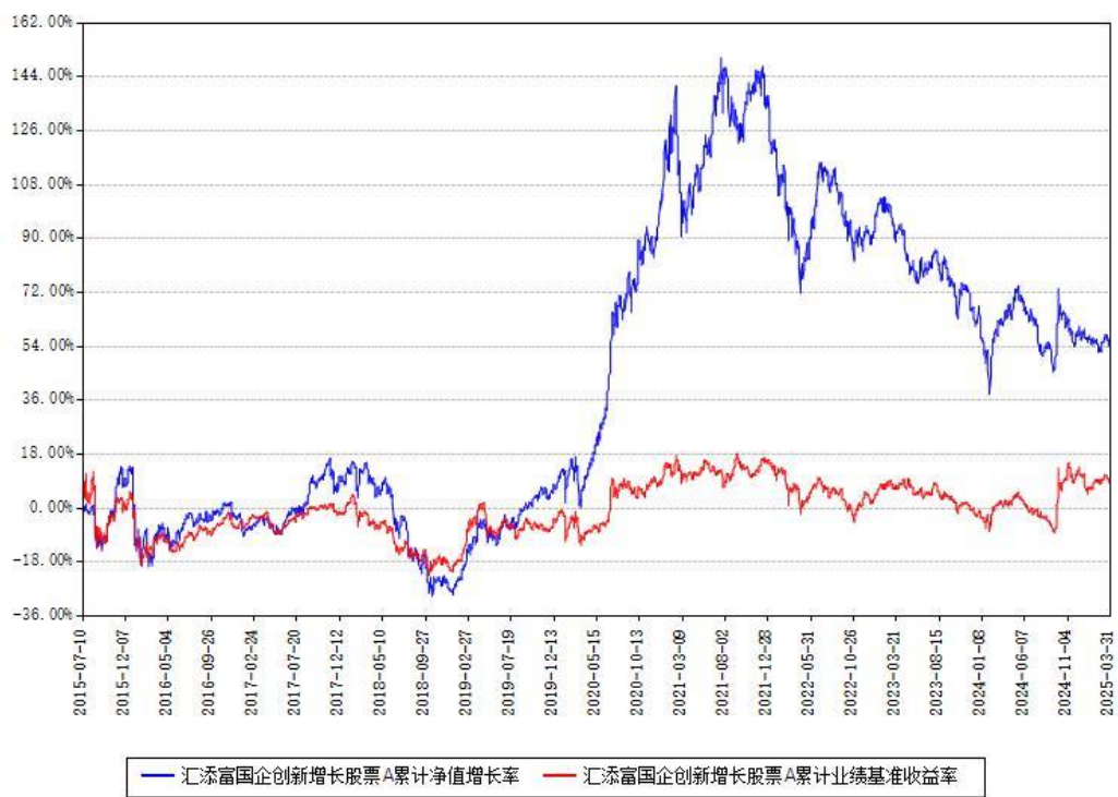
汇添富国企创新增长股票A累计净值增长率与同期业绩基准收益率对比图