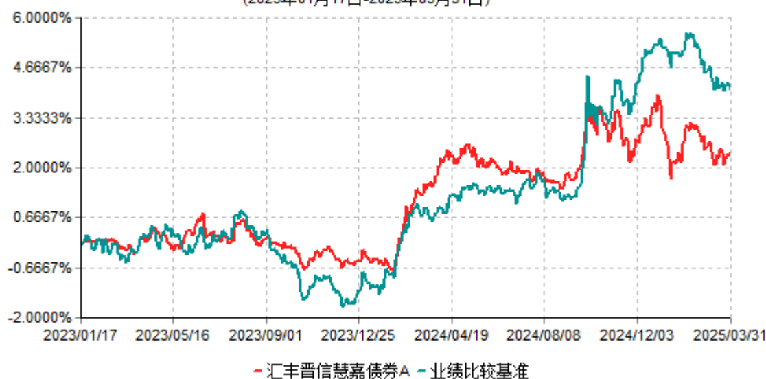
汇丰晋信慧嘉债券A累计净值增长率与业绩比较基准收益率历史走势对比图 (2023年01月17日-2025年03月31日)