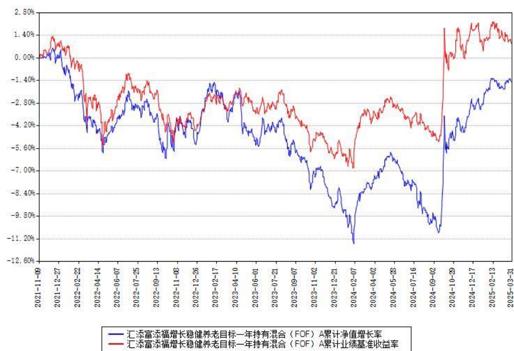
汇添富添福增长稳健养老目标一年持有混合（FOF）Y 累计净值增长率与同期业绩比较基准收益率对比图