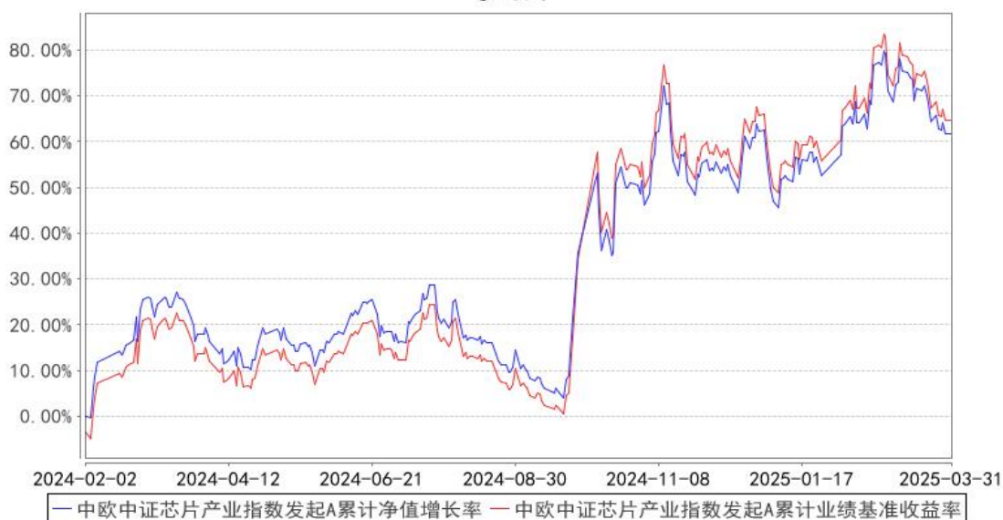
中欧中证芯片产业指数发起A累计净值增长率与同期业绩比较基准收益率的历史走势对比图

注：本基金基金合同生效日期为 2024 年 2 月 2 日，按基金合同的规定，本基金自基金合同生效起