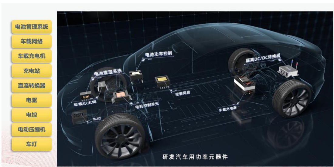
磁性元件在新能源汽车的应用