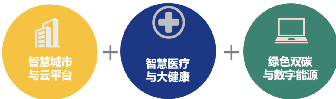
延华智能三大业务领域

运营和管理服务。作为智慧城市领域持续拓展耕耘的高科技企业，秉承“分享、合作、创造”的文化理念，通过各项技术的应用结合行业经验积淀，钻研探索各类创新解决方案，赋能智慧城市各领域的管理与服务。公司通过全生命周期的业务模式，在城市建设与运营环节配备延华云平台产品，为城市管理提供更高效、更精准的服务。