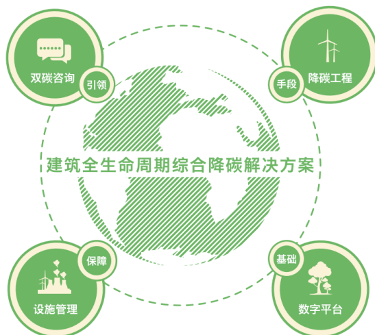
延华绿色双碳与数字能源业务全生命周期综合降碳管理和服

力大型建筑和重点用能单位的碳资产管理服务，内容涉及碳审计、碳核算、碳纳入、碳监测、碳报告、碳交易、碳清缴等全过程的碳资产管理业务，助力双碳目标达成。