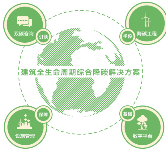
延华绿色双碳与数字能源业务全生命周期综合降碳管理和服务

报告期内，公司将节能服务与数字化、智能化深度融合发展，围绕“安全、健康、绿色、智能”战略核心，开展双碳咨询、数字能源、降碳工程、智慧运维等建筑全生命周期的服务与运营。“双碳”背景下，低碳与数字能源版块将发力大型建筑和重点用能单位的碳资产管理服务，内容涉及碳审计、碳核算、碳纳入、碳监测、碳报告、碳交易、碳清缴等全过程的碳资产管理业务，助力双碳目标达成。