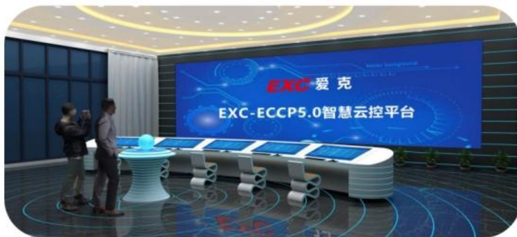
EXC-ECCP 5.0 智慧云控平台

爱克股份基于当前全国积极推进智慧城市建设的整体部署，集结诸多城市管理者的需求，对城市大数据进行有效采集与分析，依托云服务、4G/5G技术应用，在报告期内迭代了 EXC-ECCP 5.0 智慧云控平台。该平台具备强大的业务和海量数据分析处理能力，并提供了清晰明了的数据统计类图形化界面、可视化 GIS 电子地图界面等多种形式的展示界面，具备完善的智慧城市管理功能。