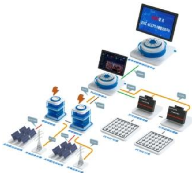
零碳智慧灯光管控系统

由零碳智慧灯光管控平台、零碳智慧云柜、零碳智慧灯光能量系统、全品类智慧灯具四部分组成的零碳灯光管控系统，通过光伏储能系统和智慧云控平台结合，可实现灯光系统零碳供电。零碳智慧灯光系统可助力产业绿色化转型、设施集聚化共享、资源循环利用，园区智慧灯光基本实现碳排放与吸收自我平衡，生产生态生活深度融合。