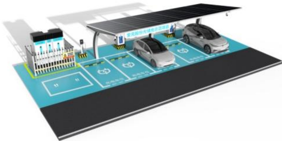
爱克股份光储充示范项目

爱克股份光储充示范项目是公司自主研发设计的集智能光伏发电系统、智能电化学储能系统、智能电动车充电系统于一体的综合能源管理系统。统一协调光伏发电、储能充放电、新能源充电系统，实现白天光伏发电，夜间/谷时储能充电，为园区用电负荷提供清洁，低价的能源，同时保障园区重要负荷停电时应急供电。