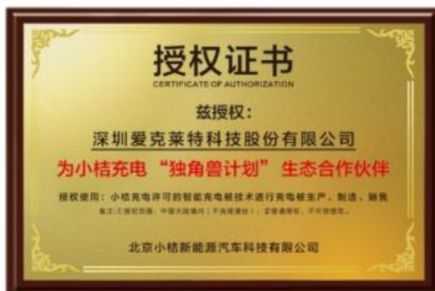
小桔充电供应链生态战略合作伙伴

强大的智造能力和自研创新能力，共同推动智能充电桩供应链生态繁荣，为电车车主打造便捷、可靠、快速、高效的充电服务体验，推动布局绿色城市新基建、助力能源数字化转型，实现碳中和。