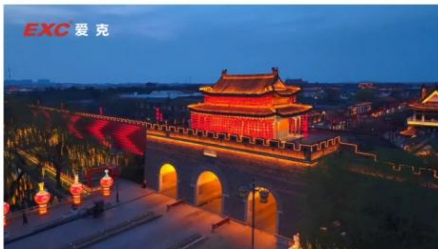
山东曲阜三孔景区文旅亮化