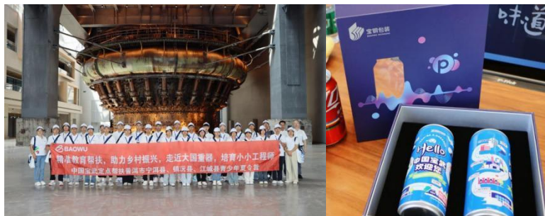
图 1: “小小工程师”暨优秀师生走进大国重器夏令营及研学纪念版定制易拉罐

宝钢包装将继续深化推进乡村振兴工作，助力帮扶地区培养更多具有创新精神和实践能力的青少年人才。