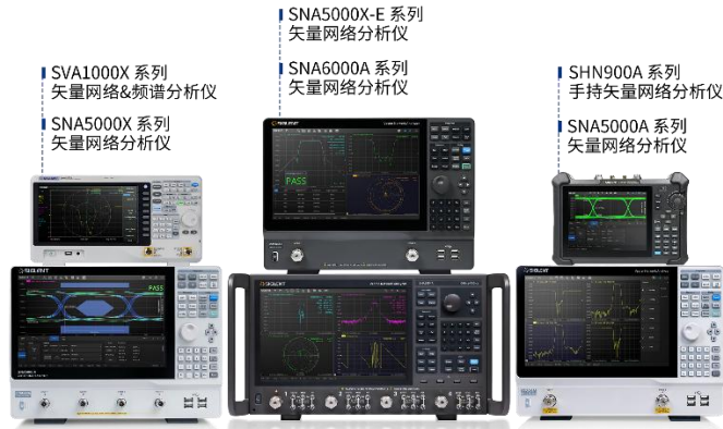
图 6：矢量网络分析仪产品

矢量网络分析仪是测量器件网络特性的仪器，它结合了频谱分析仪技术、信号发生器技术以及矢量网络分析技术等各项技术，被誉为“仪器之王”，是射频微波领域必备的测试测量仪器，并且是诸多行业专用仪器的基础形态。公司矢量网络分析仪产品可实现多端口矢量 S 参数测量，实施各档次的系统误差校准，且可具备频谱分析仪的通用特性，是高度集成的射频微波仪器。