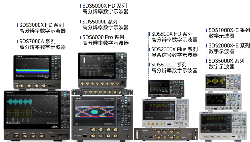
图 2：数字示波器产品