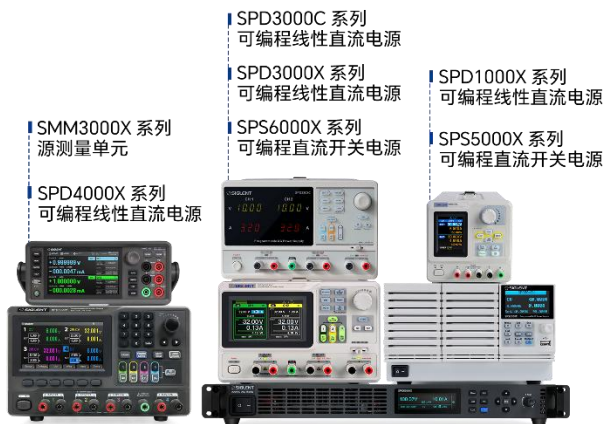
图 7：高精度可编程直流电源/源表产品