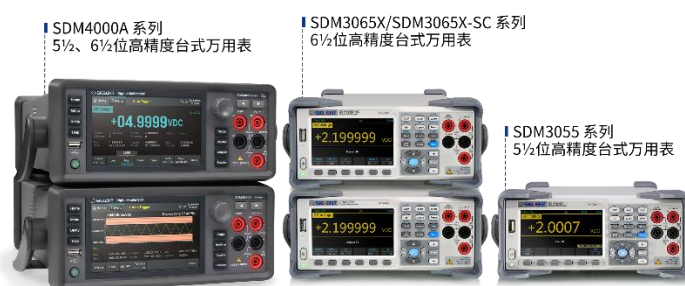
图 8：高精度台式万用表产品