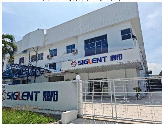
图 1：马来西亚子公司

公司主要产品包括数字示波器、频谱分析仪、信号发生器、矢量网络分析仪等通用电子测试测量行业四大主力产品，以及可编程直流电源/源表、数字万用表和电子负载。产品基本情况如下：