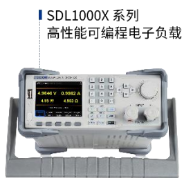
图 9：高性能可编程电子负载产品