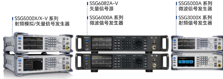
图 4: 射频微波信号发生器产品