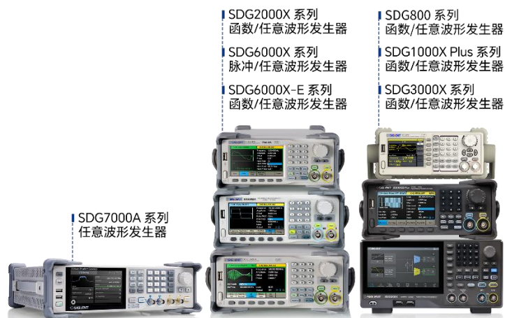
图 3：任意波形发生器产品