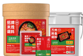
加点滋味主要产品一览