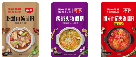
拾翠坊主要产品一览