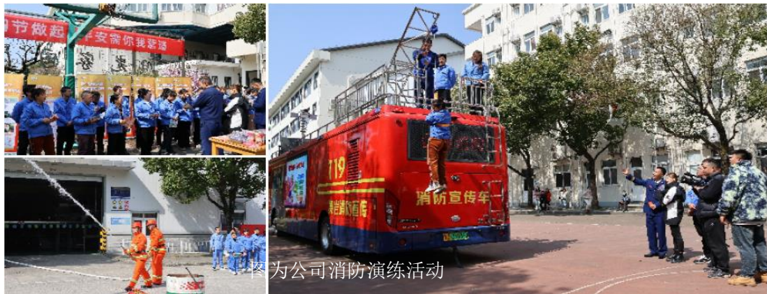
图为公司消防演练活动

为确保安全活动的有效实施，公司建立了专门的监督机制，由安全办牵头，对活动进展情况实时跟踪和评估，确保各项措施得到有效执行。在“安全生产月”期间，公司组织了宣传活动和消防逃生演练等大型活动，对公司全员分批次进行培训，营造了良好的安全氛围。