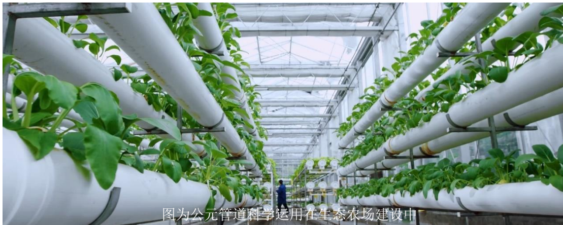
图为公元管道科学运用在生态农场建设中

理念渗透在产品研发中，推动产品创新升级。一方面，实现了企业成本、能耗的降低；另一方面，产品的质量和竞争力实现了新的突破。2021年-2023年，公元牵头或参与制定了36项国家及行业标准，并开展了《聚丙烯雨水模块高模量配方技术》《海洋养殖专用聚乙烯管道多层共混增强改性》等63项绿色设计关键技术，并全部转化到产品生产中。2023年，公元荣列浙江省第一批绿色产品(服务)认证“领跑者”名单，成为台州市四家入选企业之一、黄岩区唯一一家入选企业；2024年，公元作为唯一一家管材类企业成功入选工业和信息化部第五批工业产品绿色设计示范企业名单。