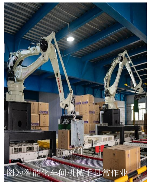
图为智能化车间机械手日常作业

公司自主研发拥有自主知识产权的智能自动化生产集成系统,让“无人工厂”和“熄灯生产”这些概念成为现实。从原材料到生产,再到包装,均引进了自动化设备,通过信息化手段,实现人机互联,对生产安全过程进行设备状态实时信息采集、反馈和处理,实现人工成本的降低、生产效率的提升、人员安全和产品质量的双保障,让生产过程更加绿色环保,更加科学合理,经过多年智能化、数字化的探索、实践和建设,公元股份“高性能管道智能工厂”被成功认定为“2023年浙江省智能工厂”。