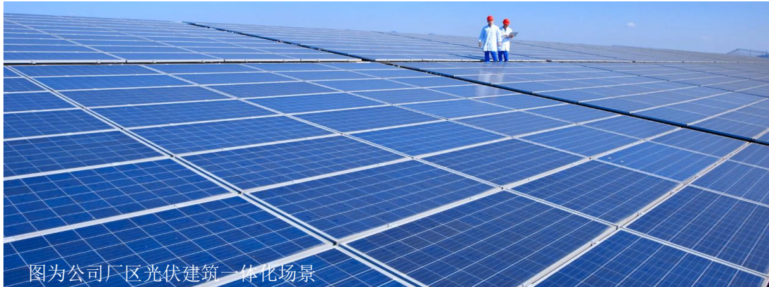
图为公司厂区光伏建筑一体化场景

从“绿色制造”到“制造绿色”,公元的科技创新在新质生产力的探索中始终发挥着关键作用。智能化、数字化和绿色化“三驾马车”并驾齐驱,推进各项工作提质增效,推动企业在高质量发展的赛道上加速奔跑。