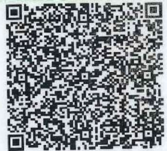
2022年白燕萍年检通过二维码

本证书经检验合格，继续有效一年。 This certificate is valid for another year after this renewal.