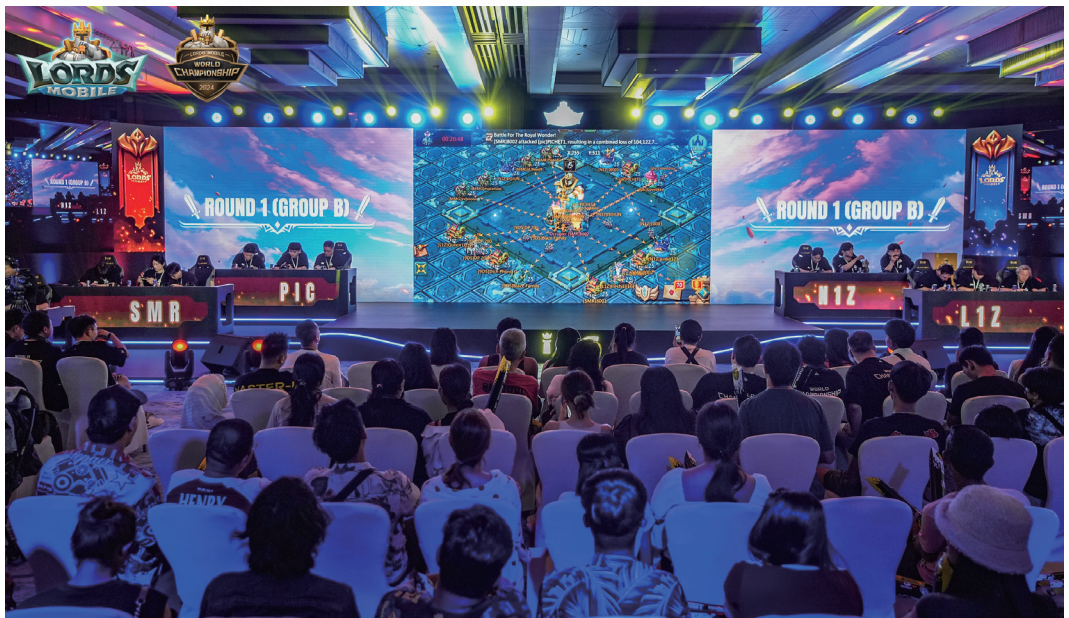
二零二四全球巔峰賽

二零二四年，我們帶給玩家多場精彩紛呈的互動活動。不僅有《王國紀元》與《Doomsday: Last Survivors》在泰國聯合推出的首個SLG全球線下電競賽，我們還在巴西、中國、西班牙、土耳其、日本、韓國等地舉辦了十餘場線下競技賽與玩家見面會。此外，各大遊戲結合其主題特色開展線下主題活動。如《王國紀元》邀請玩家參與意大利托斯卡納中世紀文化節，現場體驗遊戲風格的場景還原進現實。