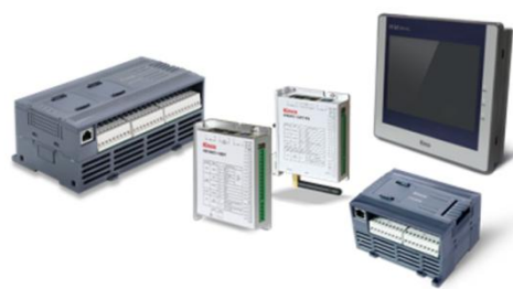
图 2：可编程逻辑控制器产品