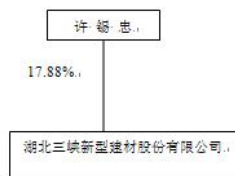
三峡新材控股股东结构图