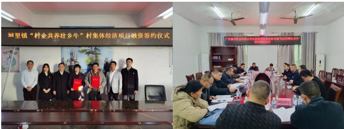
公司与来宾合山市河里镇及兴宾区桥巩镇“村企共养壮乡牛”项目

1、在结合自身产业链优势的基础上，积极、持续的实现对村集体的长效帮扶，公司与广西来宾合山市河里镇及兴宾区桥巩镇、玉林博白县等地的村集体股份经济合作社共同发展“奶牛托管—鲜奶回购”的“村企共养壮乡牛”项目，有利于提升公司水牛奶奶源的控制力，帮助村集体股份经济合作社增加收入，采用“龙头企业+政府+合作社+农户”的合作模式带动农民就业增收，转化农村闲置劳动力，实现对农户和村集体的长效帮扶，在推动和支持奶水牛产业升级发展的同时，增加农业产值，实现联农、带农、富农的乡村振兴。与广西农业信贷融资担保有限公司达成战略合作，充分发挥政策性农业信贷担保作用，引“金融活水”精准“滴灌”广西特色奶牛养殖赛道，共同推动农业产业链高质量发展。