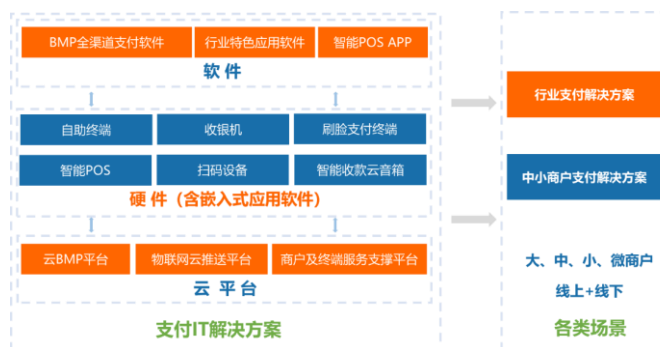
图：商户端支付解决方案

按照服务模式不同，商户规模大小，方案的个性化程度，技术实现难易程度，商户端支付解决方案分为行业支付解决方案及中小商户支付解决方案。