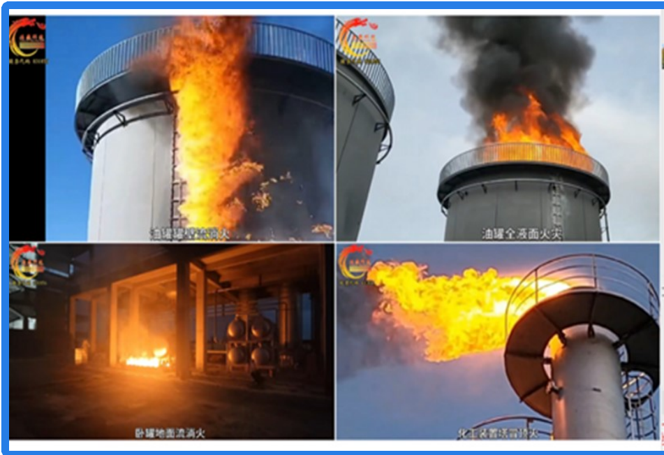
图 2 化工类火灾演示场景

公司自主开发了移动式、固定集装箱式和综合训练基地装置等真火模拟训练设施系统，该系统采用实体化、智能化场景设计，模拟各种形式火灾场景，营造真实火场高温浓烟、特殊条件下火灾的轰燃、回燃等极端火灾表现，让消防救援人员在实战训练中感受爆燃、爆炸瞬间产生的高温、热浪、气压和冲击波等火场特性；通过上述相关训练使消防救援人员掌握识别险情、躲避险情、处置险情的知识和技能，提高自救和抢险救灾救援能力，为提升消防救援队伍战斗力提供快速高效的实战解决方案。