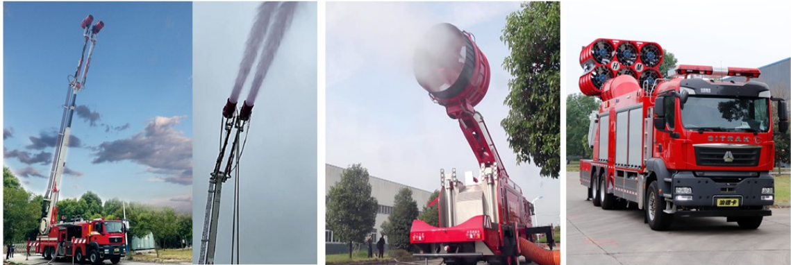
图 1 各类特种消防车

公司自主开发了移动式、固定集装箱式和综合训练基地装置等真火模拟训练设施系统，该系统采用实体化、智能化场景设计，模拟各种形式火灾场景，营造真实火场高温浓烟、特殊条件下火灾的轰燃、回燃等极端火灾表现，让消防救援人员在实战训练中感受爆燃、爆炸瞬间产生的高温、热浪、气压和冲击波等火场特性；通过上述相关训练使消防救援人员掌握识别险情、躲避险情、处置险情的知识和技能，提高自救和抢险救灾救援能力，为提升消防救援队伍战斗力提供快速高效的实战解决方案。