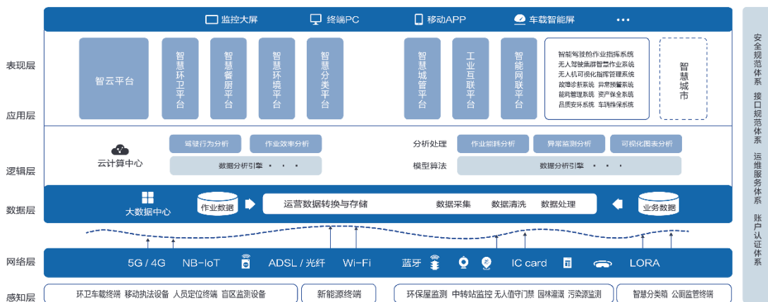
智慧环卫云平台总体架构