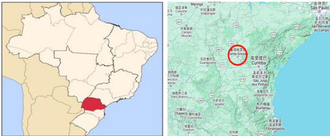
项目建设地区域位置图

本项目建设地点位于巴西巴拉纳州（Paraná）蓬塔格罗萨（Ponta Grossa）。