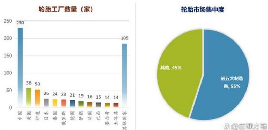
全球汽车轮胎主要生产工厂数量及市场集中度分析

汽车轮胎制造市场是一个相对比较集中的市场，全球约有 700 家制造工厂，其中中国有 230 家，约占全球三分之一，其他地区如美国 56 家，印度 53 家，日本 26 家，泰国 24 家，俄罗斯 23 家，德国 21 家。全球主要汽车轮胎制造商包含 Bridgestone, Michelin, GoodYear, Continental, Sumitomo, Pirelli, Hankook, Yokohama, 中策橡胶, ToyoTireCorporation, Maxxis, 赛轮轮胎, Apollo Tyres, 佳通轮胎, Kumho Tire, MRF, 玲珑轮胎, Nexen Tire, Nokian Tyres, JK Tire, 双钱轮胎, 三角轮胎, 贵州轮胎, 建大轮胎, 青岛双星轮胎等，其中 Bridgestone 是全球最大的制造商，2022 年年销售额达到 227.08 亿美元，占有全球 16.52% 的市场份额，全球前五大企业合计占有超过 55% 的市场份额。