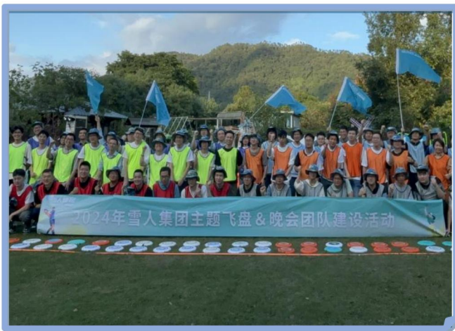
2024年公司开展的主题飞盘活动

4、日常工作之余，公司积极开展丰富多彩的文化体育活动，营造积极、健康、活跃的企业氛围，充实员工的业余生活，增强团队凝聚力。配备了篮球场、台球室、健身房等活动场地。定期组织各种党员活动、好书分享活动、团建活动、座谈会等，多维度丰富员工的工作生活。