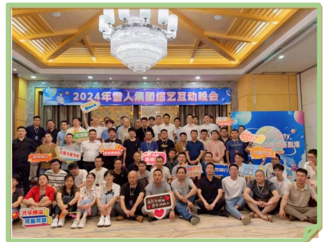
2024年公司举办综艺互动晚会