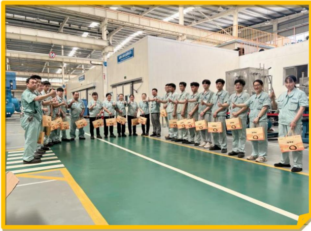
2024 年公司为员工发放中秋礼品

3、2024 年度，公司组织“节日送温暖”活动，春节、中秋佳节、圣诞节等节日都为公司员工送去精美礼品，给员工提供一个温暖的工作环境；不仅如此，公司还组织开展丰富多彩的妇女节系列活动，给女职工们送上一份特别的节日祝福。