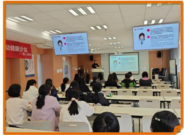
2024 年妇女节公司开展职业女性健康沙龙

4、日常工作之余，公司积极开展丰富多彩的文化体育活动，营造积极、健康、活跃的企业氛围，充实员工的业余生活，增强团队凝聚力。配备了篮球场、台球室、健身房等活动场地。定期组织各种党员活动、好书分享活动、团建活动、座谈会等，多维度丰富员工的工作生活。