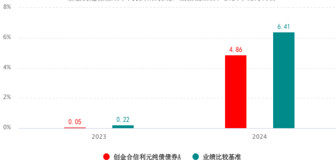
基金的过往业绩不代表未来表现，数据截止日：2024年12月31日