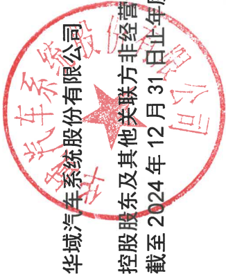
华域汽车系统股份有限公司 控股股东及其他关联方非经营性资金占用及其他关联资金往来情况汇总表 截至2024年12月31日止年度