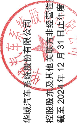
华域汽车系统股份有限公司 控股股东及其他关联方非经营性资金占用及其他关联资金往来情况汇总表 截至2024年12月31日止年度