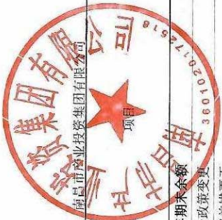
母公司所有者权益变动表 2024年度