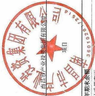
母公司所有者权益变动表 2024年度