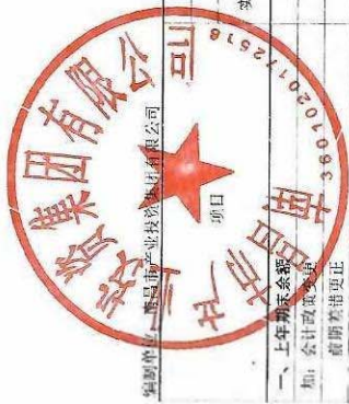
合并所有者权益变动表