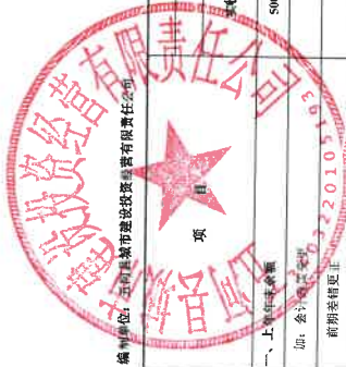
合并所有者权益变动表