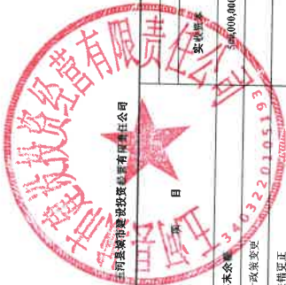
合并所有者权益变动表