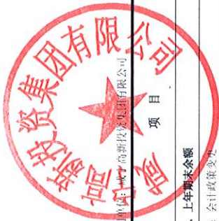
母公司所有者权益变动表