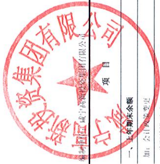
母公司所有者权益变动表