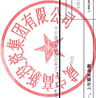
合并所有者权益变动表