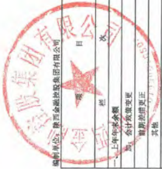
母公司所有者权益变动表 (续) 2024年度