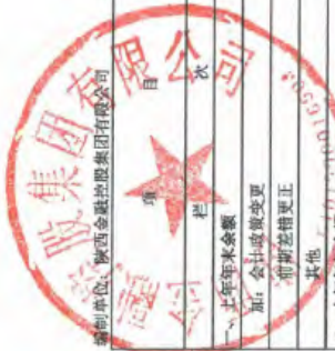
母公司所有者权益变动表 2024年度