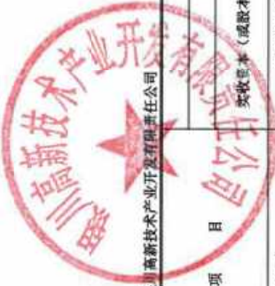
合并股东权益变动表（续） 2024年度