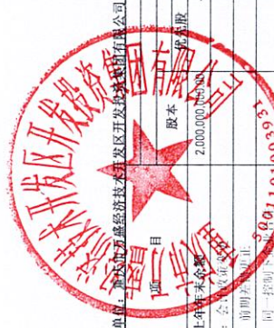
合并股东权益变动表