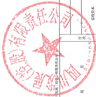
合并所有者权益变动表(续)