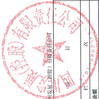
母公司所有者权益变动表 2024年度