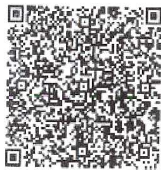
2022年杨树杰年检通过二维码

本证书经检验合格，继续有效一年。 This certificate is valid for another year after this renewal.