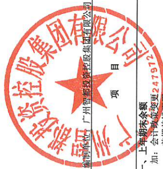
合并所有者权益变动表