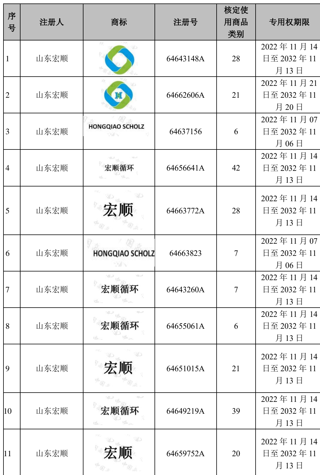
附表五：《宏拓实业及其境内控股子公司拥有的主要注册商标情况》