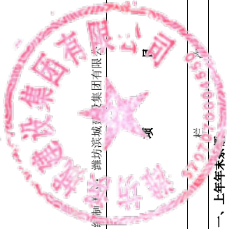
公司所有者权益变动表