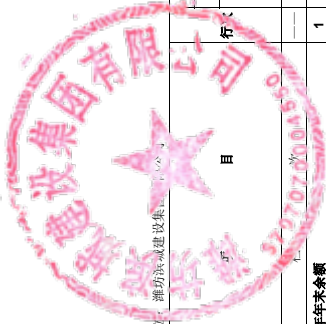
合并所有者权益变动表