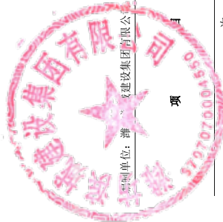
公司所有者权益变动表(续)