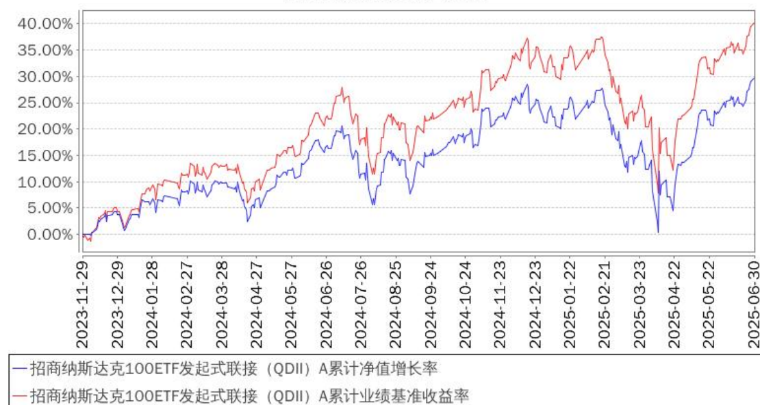
招商纳斯达克100ETF发起式联接 (QDII) A累计净值增长率与同期业绩比较基准收益率的历史走势对比图