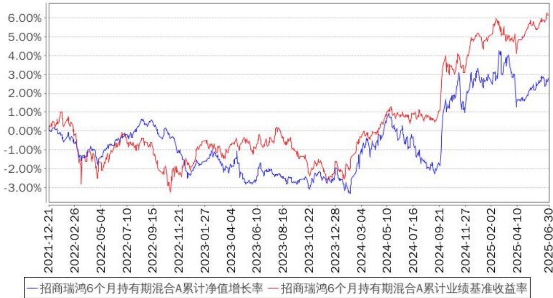
招商瑞鸿6个月持有期混合A累计净值增长率与同期业绩比较基准收益率的历史走势对比图