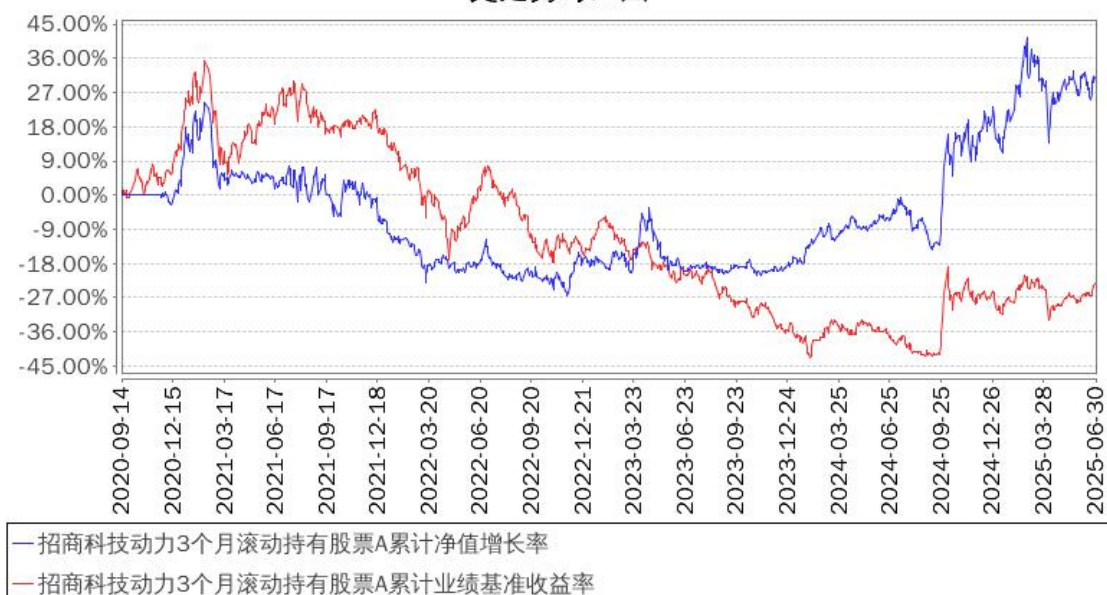
招商科技动力3个月滚动持有股票A累计净值增长率与同期业绩比较基准收益率的历史走势对比图