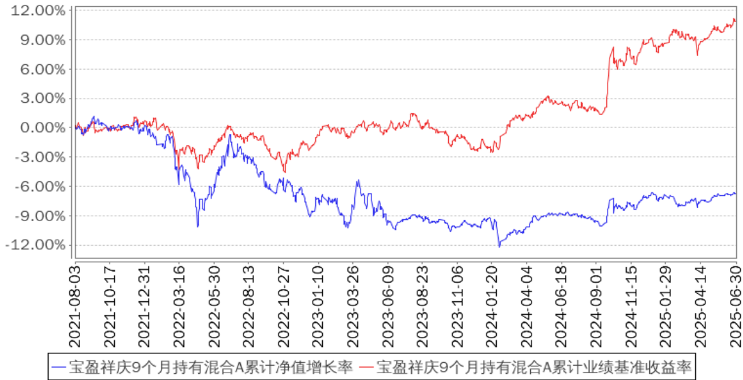
宝盈祥庆9个月持有混合A累计净值增长率与同期业绩比较基准收益率的历史走势对比图