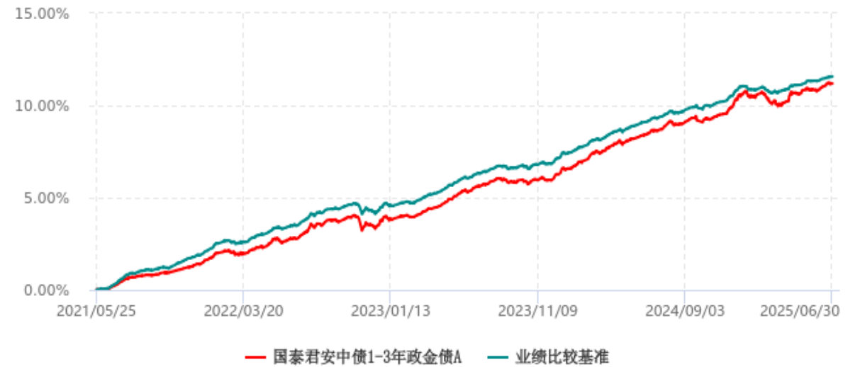
国泰君安中债1-3年政金债A累计净值增长率与业绩比较基准收益率历史走势对比图 (2021年05月25日-2025年06月30日)