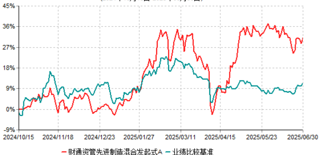
财通资管先进制造混合发起式A累计净值增长率与业绩比较基准收益率历史走势对比图 (2024年10月15日-2025年06月30日)