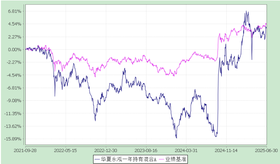
华夏永泓一年持有混合 C: