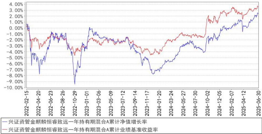
兴证资管金麒麟恒睿致远一年持有期混合A累计净值增长率与同期业绩比较基准收益率的历史走势对比图