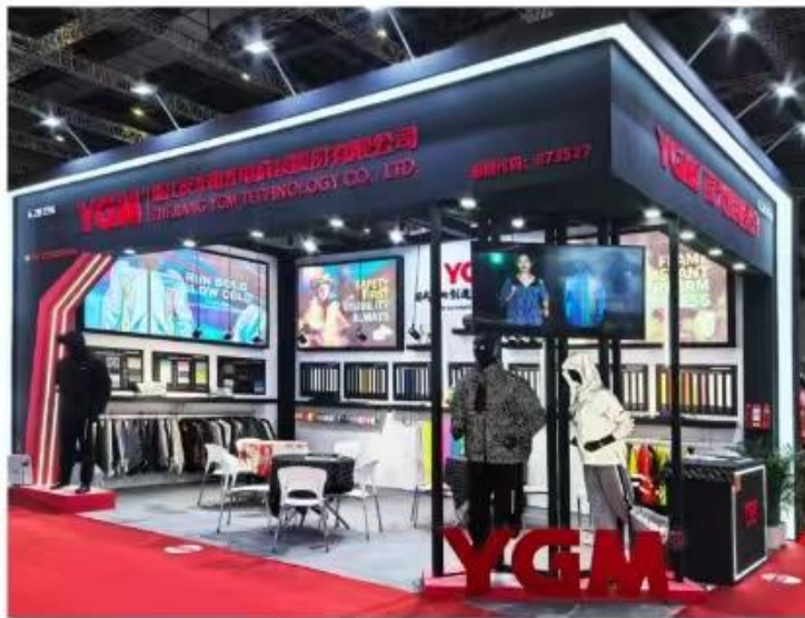
上图为：2025年3月11日-3月13日，夜光明参加上海面辅料展；