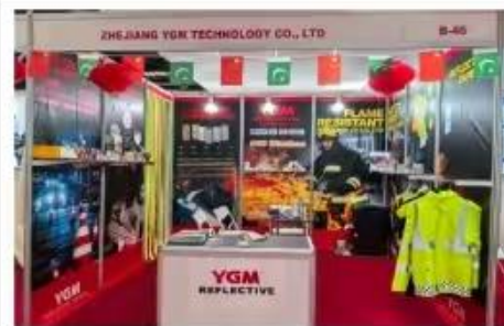
上图为：2025年4月12-4月14日，夜光明参加巴基斯坦纺织展会；