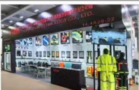
上图为：2025年5月1-5月5日，夜光明参加第137届中国进出口商品交易会；