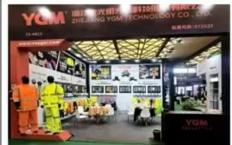
上图为：2025年4月15-4月17日，夜光明参加上海劳保展；