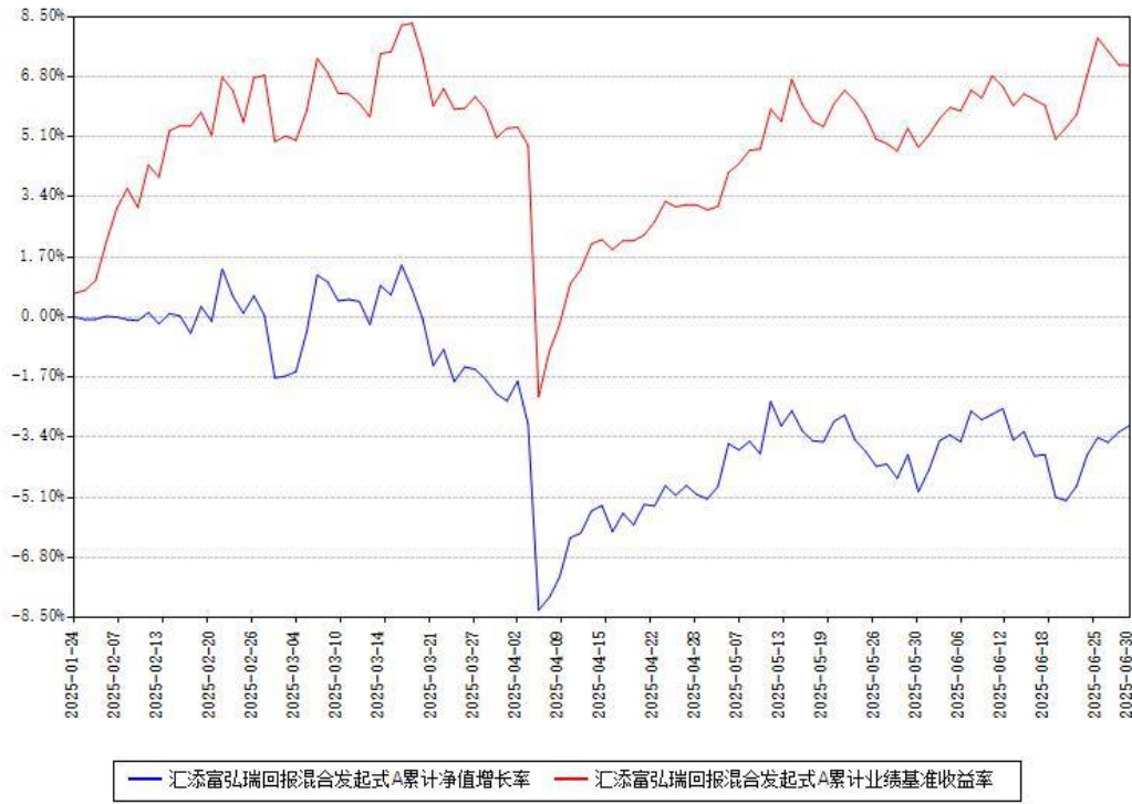
汇添富弘瑞回报混合发起式A累计净值增长率与同期业绩比较基准收益率对比图