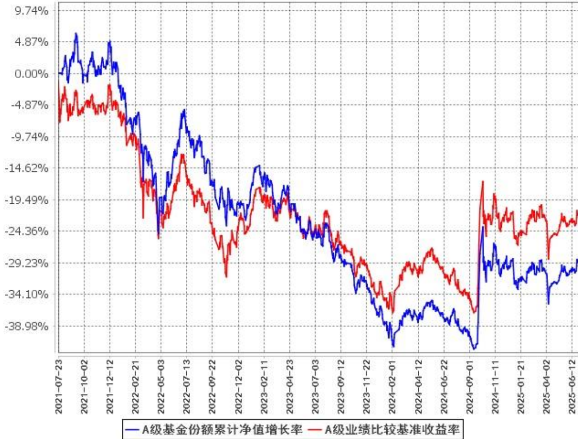
A级基金份额累计净值增长率与同期业绩比较基准收益率的历史走势对比图 (2021年7月23日至2025年6月30日)