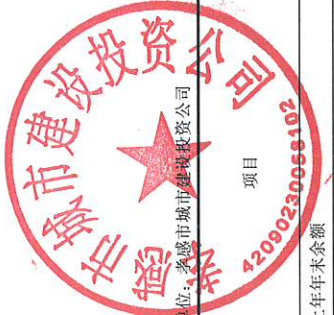
母公司所有者权益变动表